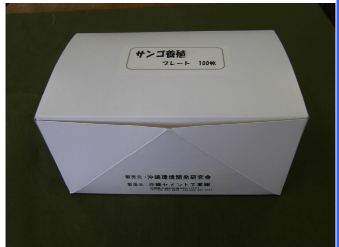
100枚入りパッケージ